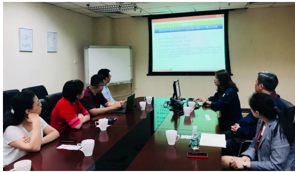
中新融创资本管理有限公司代表与先进半导体材料（深圳）有限公司代表进行交流座谈

2019年5月30日,百强会组织中中新融创资本管理有限公司代表走进先进半导体材料（深圳）有限公司和深圳欧陆通电子有限公司进行投融资交流。