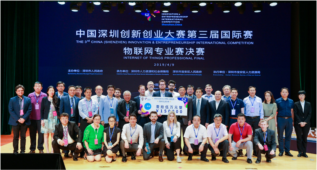
嘉宾、评审及参赛选手合影

2019 年 4 月 9 日下午，由深圳市人民政府主办，深圳市人力资源和社会保障局、宝安区人民政府共同承办、深圳市宝安区人力资源局负责执行、宝安区五类百强企业联合会协办的中国深圳创新创业大赛第三届国际赛宝安区物联网专业赛决赛在宝安区青少年活动服务中心梦剧场举行。从全球 9 个国家、10 个城市晋级的 14 个海归项目团队齐聚宝安，参加第三届深创赛国际赛物联网专业决赛，并决出一二三等奖。