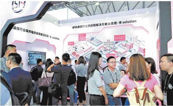
华讯方舟展位吸引全球客商

在此次MWC期间，顺丰移动行业解决方案·丰Solution+的推出，标志着顺丰聚焦行业、深耕行业、服务行业的决心和信心。将有效促进通信行业和物流行业的深度交融，从而推动双方技术升级，更好地服务移动体系和产业链上下游，助力行业客户打造与其战略相匹配的高效供应链体系。