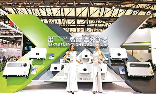
SNEC 展会古瑞瓦特新品展示区

引领，关键在于发挥综合实力的优势。古瑞瓦特在生态、科技研发、资源整合、服务体验方面深度布局，同时在用户信任度、渠道渗透力、营销模式等领域不断创新引领。始终践行用户体验至上的开发和服务理念，是这次惊艳全场的古瑞瓦特创新科技成果的强大驱动力。”他表示，未来，古瑞瓦特将持之以恒地为广大用户带来更多令人欣喜的好方案和好产品，坚持不懈为创造更智能的智慧能源生活场景而努力。