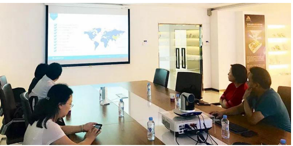
中新融创资本管理有限公司代表与深圳欧陆通电子有限公司代表进行交流座谈

同日下午,百强会带领中新融创资本管理有限公司代表走访深圳欧陆通电子有限公司,宝安区企业服务中心副主任