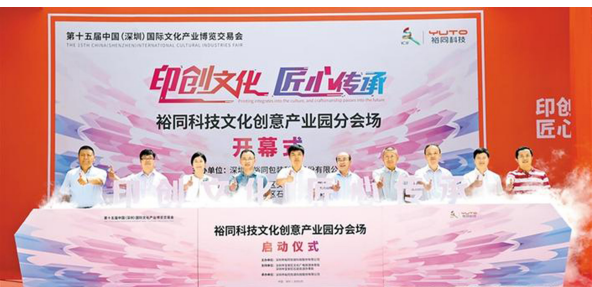
裕同科技文化创意产业园分会场启动仪式

电子标签、AR技术、矿物质水墨等多方面的高端技术为自身的文化产品赋予更多科技内涵，裕同希望继续在文化印刷领域搭建开放性平台，推动深圳文化产业可持续发展，并为中国文化产业走向世界积极赋能。