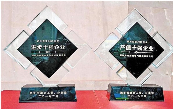
西乡街道“产值十强企业”“进步十强企业”奖牌

近日,西乡街道召开2019年经济工作会议,对2018年度辖区内经济效益突出、发展迅速的30多家企业与10名十佳统计员进行了表彰。深圳市高斯宝技术电气有限公司(简称“高斯宝”)荣获2018年