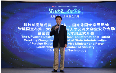
科技部党组成员，科技部副部长，国家外国专家局局长张建国宣布开幕

深圳市副市长艾学峰先生为本次人才周开幕式致辞。他指出深圳习作为中国改革开放的窗口，在全国率先激活用人制度，较早开展市场化引才，充分享受了海内外人才集聚的红利，特别是国家外专局、省人设厅、社会各界的支持下，中国国际人才交流大会长期落户广东。