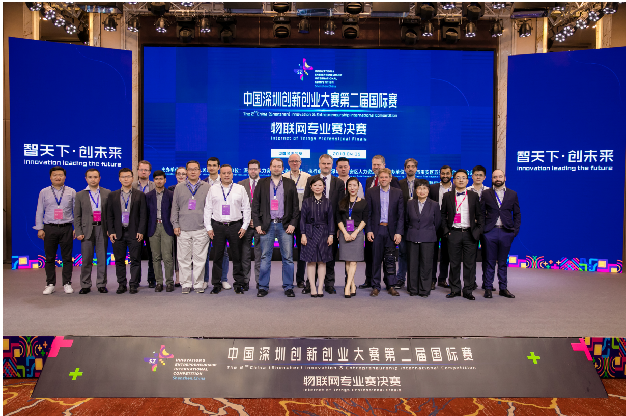
嘉宾、评审及参赛选手合影

2018 年 4 月 9 日下午，由中华人民共和国科学技术部、国家外国专家局指导，深圳市人民政府主办，深圳市人力资源和社会保障局、深圳市科技创新委员会、深圳市宝安区人民政府共同承办，深圳市宝安区人力资源局负责执行，深圳市宝安区五类百强企业联合会、IBM 沃森物联网中心、Green box 全球控股有限公司共同协办的中国深圳创新创业大赛第二届国际赛物联网专业赛决赛在宝安区万悦格兰云天酒店举行。