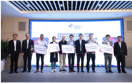
中国深圳创新创业大赛宝安三大赛事颁奖仪式

梧桐已栽好，只等风来栖。随着第16届中国国际人才交流大会暨宝安2018国际人才周活动启幕，宝安人才发展掀开新篇章，宝安区委区政府、宝安区人力资源与社会保障局将在人才引进和发展上迈向新的征程，通过进一步深化国际人才合作，不断推动宝安大湾区人才高地建设，以人力资源创新发展为宝安经济发展提供新动能。