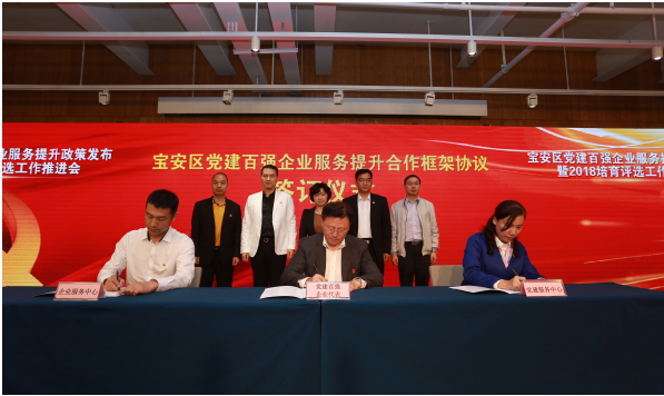
党建百强企业服务提升政策发布会暨 2018 培育评选工作推进会现场

党建工作应围绕中心、服务大局，与业务工作相辅相成，这是做好党建工作的重要遵循。推进“两新”组织党建工作深入开展，关键是要找准党建工作和促进“两新”组织发展的结合点，使党建工作作为“两新”组织所需要，在促进“两新”组织的发展中，不断巩固和提高党的领导基础和地位。