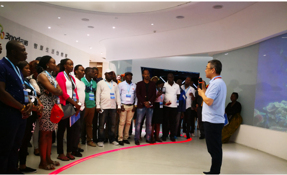
37 个国家近 80 名青年领导人 莅访百强会会长单位三诺集团参观交流

在深圳智慧生活创想馆，外宾一行参观考察了三诺的产业布局，并体验了三诺原创设计制造的智慧平板、智慧云影音产品、3D 互动儿童认知产品、互动智慧教育平台，以及三诺构建的足不出户就能享受远程教育、医疗、购物、娱乐