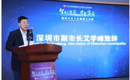
深圳市副市长艾学峰致辞

科技部党组成员、科技部副部长、国家外国专家局局长张建国先生宣布：“第16届国际人才交流大会宝安分会场暨宝安2018国际人才周正式开幕”，人才的盛会正式拉开帷幕。