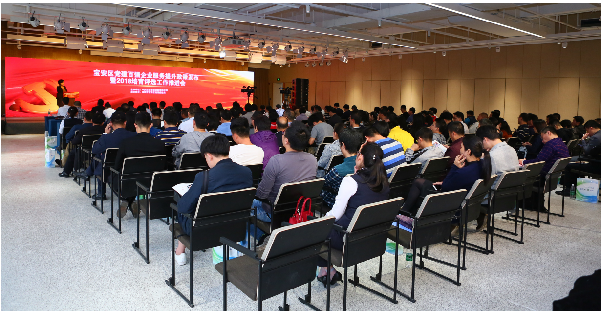
宝安区党建百强企业服务提升合作框架协议签订仪式

人才是第一资源。近年来，宝安区委、区政府坚持以党管人才为核心，充分发挥党对人才的政治引领作用，先后出台“凤凰工程”“产业高端人才引进计划”等一系列人才政策，出台宝安人才“88条”，实施紧缺人才引进“1000工程”，