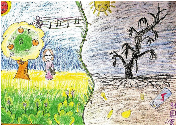
佳沃鑫荣懋员工孩子画的关于土地污染的作品

据透露，“爱我沃土，善源行动”行动将在佳沃鑫荣懋集团长期延续下去，作为对环境保护、对建设美丽中国